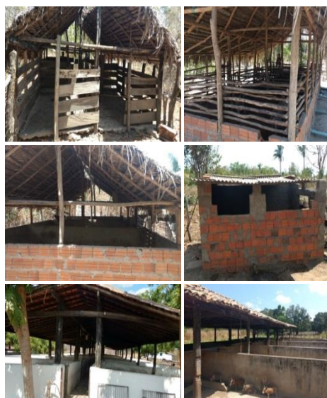
Figura 2 – Instalações nas propriedades dos pequenos produtores de suínos no município de Caxias/MA.

Por sua vez, o piso das instalações dos pequenos criadores que participaram do estudo apresenta cimento liso (80%), construídos em alvenaria com tijolos furados (85%), cobertos de telha cerâmica (60%), com luz elétrica e água encanada (40%), com bebedouro chupeta (80%) e comedouro de alvenaria (75%), tendo a água utilizada na criação advindo de poço (95%), no entanto, há instalações com piso de areia e chão batido (10% cada), com paredes de madeira (15%), com telha de fibro-cimento e madeira/palha (10 e 30%, respectivamente), com apenas água encanada (30%), com bebedouro em cocho coletivo (20%) e sem um comedouro específico (chão – 05%) (Tabela 4).