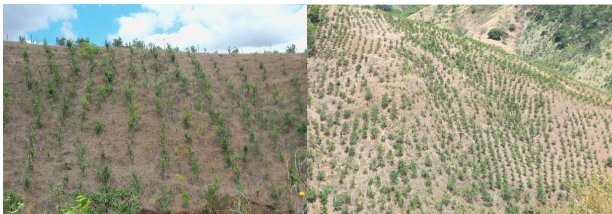
Figura 3. Plantio de laranja lima sem respeitar as curvas de nível em Santana do Mundaú - AL.

Contudo, os pomares apresentam baixa produtividade em decorrência de carência de utilização de técnicas agrônomicas adequadas e escassez de assistência técnica. Segundo Ferreira et al. (2012) outro fator limitante da produção é a forma como historicamente foram implantados os pomares em “morro a baixo” (Figura 3), e ainda persistindo ausência de práticas de calagem, adubação e controle de pragas e doenças, colocando em risco a sustentabilidade da citricultura local e reduzindo a competitividade da laranja lima produzida no município (FERREIRA et al., 2012). A utilização de mudas sem garantia fitossanitária também é um dos graves problemas na região, possibilitando a disseminação de pragas, doenças e reduzindo o tempo de vida útil dos pomares.