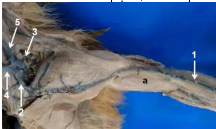
Figura 1. Vista cranial da região do braço e antebraço e vista ventro-lateral do pescoço de macaco-prego ( Sapajus libidinosus ), destacando a veia cefálica (1), anastomose com a veia linguofacial (2), veia omobraquial (rompida) (3), veia linguofacial (4), veia maxilar (5), e músculo bíceps braquial (a)

Apesar dos aspectos analisados em macacos-prego, Carneiro et al. (2014) em inquérito sorológico para Toxoplasma gondii em mamíferos neotropicais mantidos no Centro de Triagem de Animais Silvestres em Goiânia, GO, na coleta de todas as amostras biológicas (sangue), utilizou como uma das vias de venopunção, a veia cefálica. Há ocorrência, ainda, da utilização da veia cefálica para coleta de sangue em catetos ( Tayassu tajacu ) (ALMEIDA et al., 2011), bicho preguiça ( Bradypus variegatus ) (RAMOS, 2007), e animais do gênero Dasyprocta (BAAS et al., 1976; QUEIROZ et al., 1996), no entanto, Pachaly et al. (2000), em estudo realizado em 158 animais da família Dasyproctidae , verificou que as veias cefálicas além de possuírem um calibre pequeno, também rompem facilmente.