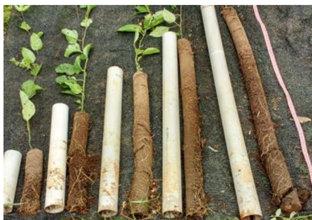
Figura 1. Tamanho dos recipientes utilizados para produção de muda alta de maracujazeiro-amarelo.

Os tratamentos constituíram-se de diferentes tamanhos de recipientes: 25 cm, 50 cm, 75 cm; 100 cm e 125 cm (estes tratamentos equivalem a aproximadamente 1,1, 2,2, 3,3, 4,4 e 5,5 L de substrato). Os recipientes usados foram tubos de Policloreto de Vinil (PVC) de 75 mm de diâmetro (Figura 1).